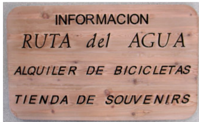
Grabado bajo relieve en madera natural y posterior pintado