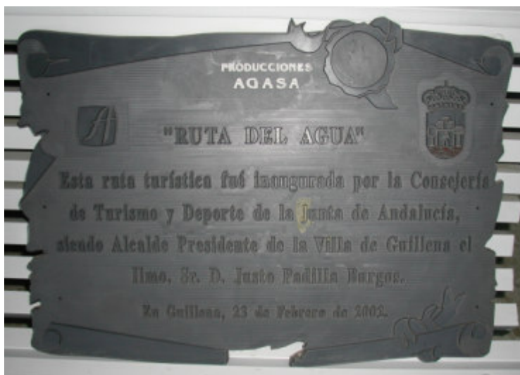
Mecanizado sobre relieve en PVC de 25mm, para su utilización como modelo de fundición