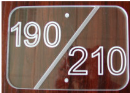
Grabado a espejo en metacrilato de 10 mm