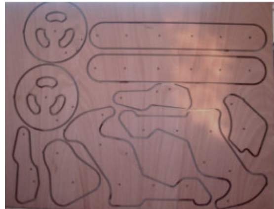
Optimización de despieces de tableros por Nesting