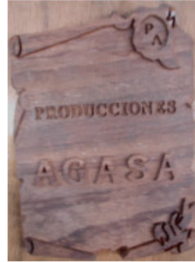
Escudo original mecanizado en madera de Iroko para su utilización como modelo de fundición