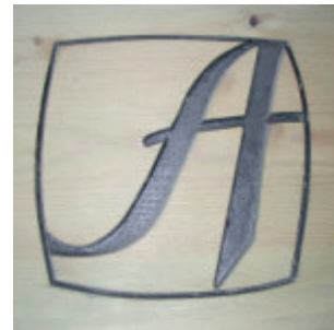
Grabado en madera natural y posterior pintado